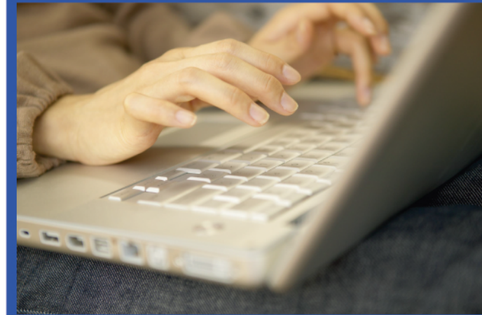
无心之失和不可靠的硬盘是导致数据丢失的两大原因